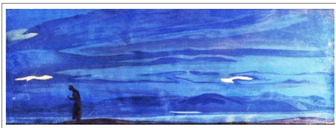
Н.К. Рерих. Царевна со стрелами. 1918.